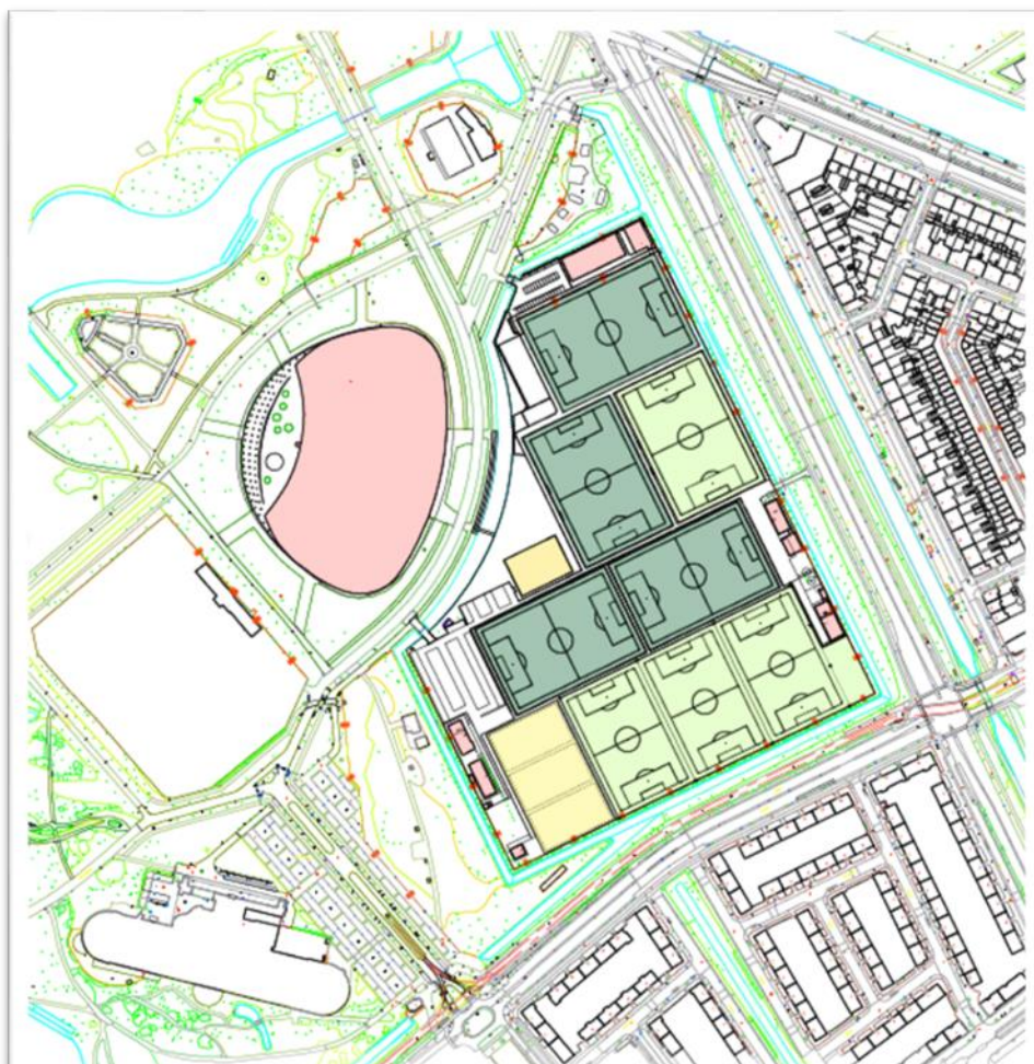
Overzicht huidige indeling Sportpark Zuiderpark

Er zijn met het Haags Sportkwartier initiatieven gestart om, met de Sportcampus als middelpunt, via beweeglabs meer mensen in beweging te brengen. Het ontbreekt de Sportcampus echter nog om een open, transparante en laagdrempelige verbinding met de wijk 14 te leggen. Bewoners uit omliggende wijken ervaren de Sportcampus als een gesloten geheel.